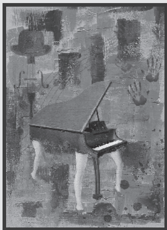
「なんとなくエロスなピアノ」