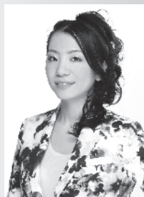
フルート 栗谷かずよ kuriya kazuyo (Singer Song Writer KAJU)