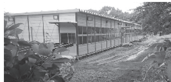
▲現在建設中の仮設の校舎