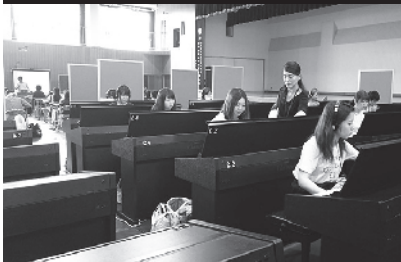
▲体育館にビニールシートを敷き、パーテーションで仕切られた応急的な講義室。手前では電子ピアノを使った授業が、奥ではまた別のクラスの授業が

御船町にある平成音楽大学。声楽・ピアノ・管弦打楽器等の実技や、作曲、音楽療法などを学ぶ(音楽学科)と、幼児教育者を育成する(こども学科)があり、県内外から約400人の学生が学んでいます。