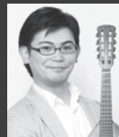
ゲストコンサートマスター 福屋 篤