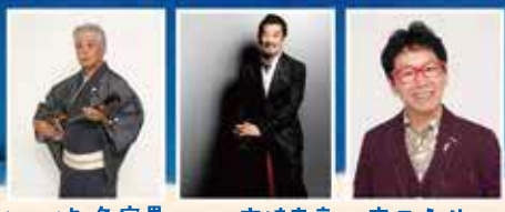
プロデューサー 知名定男 | 友情出演 宇崎竜童 | 南こうせつ