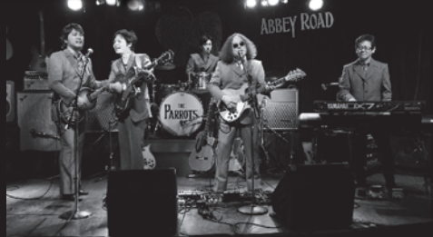
THE PARROTS DINNER SHOW