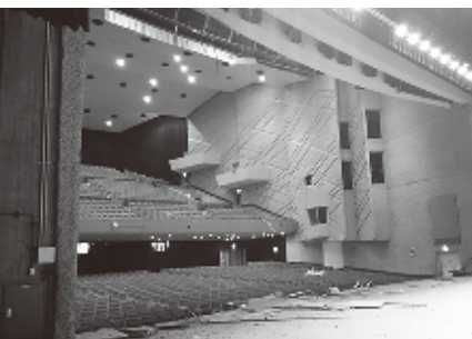
▲被災し、現在も休館中の熊本市市民会館(4月末の様子)

4月14日夜の前震に続き、16日未明の本震。2回の地震を受け、熊本県内のほとんどのホールが休館。予定されていた公演は公演中止や延期を余儀なくされました。公演主催者は、チケットの払戻しの対応をしたり、延期したくてもホール再開の見通しが立たず決定できない状況が続きました。