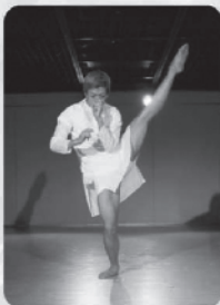
振り付け・ダンス：木原浩太