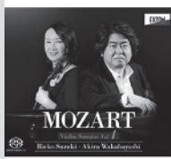
モーツァルト: ヴァイオリンソナタ集 vol.1 2015年 オクタヴァレコード OVCL-00574 ★レコード芸術2015年11月号にて「特選盤」