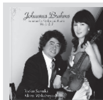
ブラームス: ヴァイオリンソナタ全集 2013年 king international KKG34

日本を代表するヴィルトゥオーゾ・ピアニスト。17歳で日本音楽コンクール第2位。東京芸大を経てザルツブルクモーツァルテウムとベリリン芸術大学院で研鑽を積み。85年ブノエ国際ピアノコンクール第2位、87年カーネギーホールデビュー。各地でリサイタルや国内外のオーケストラとの共演を重ねている。桐朋学園大学特任教授、国立音楽大学招聘教授。 http://www.wakabayashi-skira.com