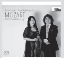
モーツァルト: ヴァイオリンソナタ集 vol.2 2016年 オクタヴァレコード OVCL-00604 ★レコード芸術2016年11月号にて「特選盤」