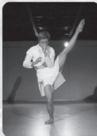
振り付け・ダンス：木原浩太