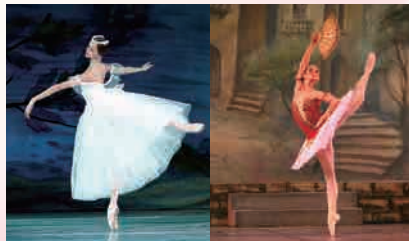
▲ロマンティック・チュチュ

これまでバレエの魅力についてご紹介してきましたが、いかがでしたでしょうか。バレエを習っている人も、そうでない人にとっても、こういったバックグラウンドを知ってからバレエを観ると新たな発見があると思います。長い歴史の中で脈々と守り続けられてきたクラシックバレエの公演がこの夏熊本で開催されます、どうぞお楽しみに!