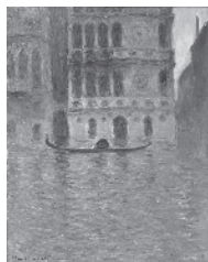
ターナーからモネへ ウェールズ国立美術館所蔵 National Museum of Wales

[料]一般1300(1100)円/高・大学生800(600)円、( )内は前売・団体20名以上、中学生以下、障がい者手帳をお持ちの方は無料[場]熊本市中心区二の丸2番[問]096-352-2111[営]9:30~17:15(入館は16:45まで)[休]月曜(但し8/14は臨時開館)